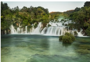
Krka national park